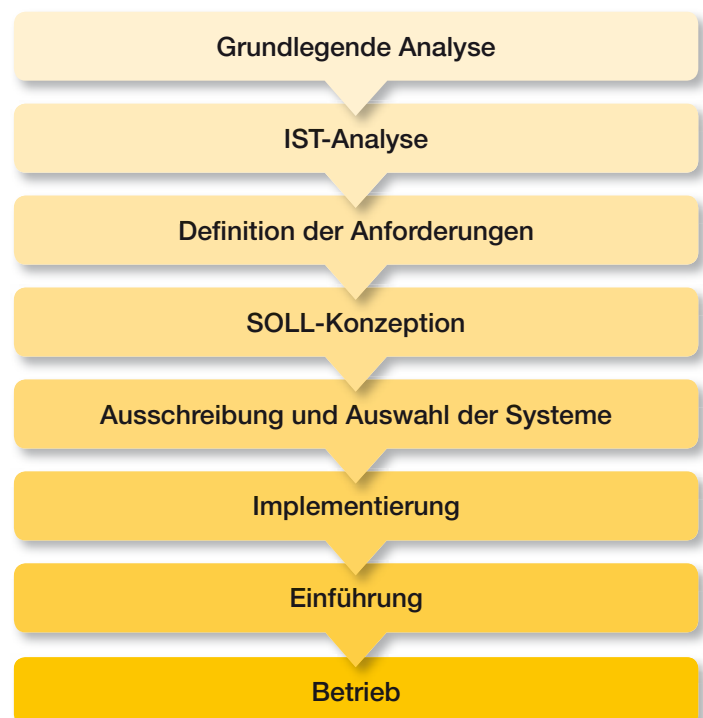
Abb. 2: Phasen der Einführung eines DMS

Die Einführung eines DMS sollte in jedem Fall als Projekt angelegt werden. Die Projektgröße – Zahl der beteiligten Personen, erforderlicher Zeithorizont – hängt vom Spektrum der Funktionen ab, mit denen die Verwaltung von Dokumenten unterstützt werden soll. Der Projektablauf vollzieht sich grundsätzlich in den in der Abb. 2 genannten Phasen.