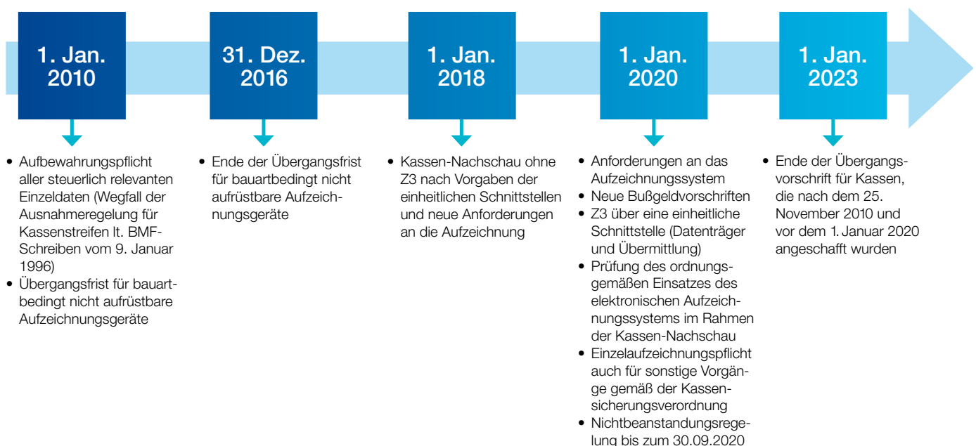
Abb. 4: Zeitliche Abfolge des Inkrafttretens der neuen Vorschriften

PKF Fasselt Schlage stellt Erfahrungen aus kassenbezogenen Projekten und Branchen-/IT-Experten für die rechtssichere integrierte Lösung typischer Fragestellungen im Kassenumfeld sowie für die vollständige Planung und Umsetzung von Kassenprojekten zur Verfügung.