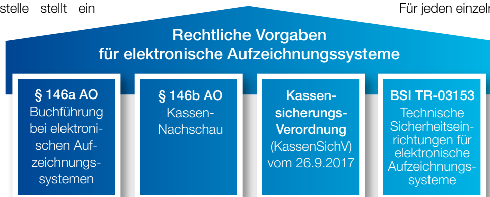
Abb. 1: Rechtliche Vorgaben

Für jeden einzelnen Geschäftsvorfall bzw. anderen Vorgang müssen einzeln die folgenden Angaben aufgezeichnet werden: