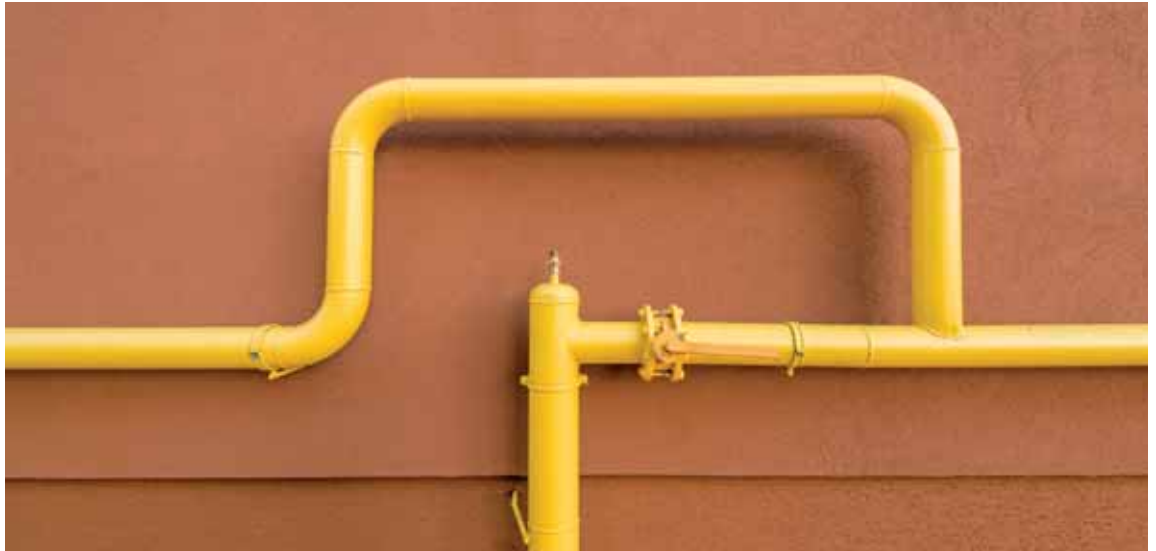
Preissenkungen müssen auch tatsächlich an den Energiekunden durchgereicht werden.

Sofern der Energievertrieb interne Verrechnungen vornimmt, kann das einer ansonsten zulässigen Rückstellung zuwiderlaufen.