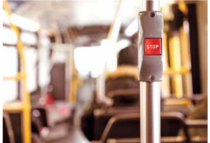
Dienstleistungskonzession im ÖPNV sollte extern geprüft werden.

Eine Dienstleistungskonzession liegt vor, wenn die Übertragung eines betrieblichen Risikos auf den Auftragnehmer derart gestaltet ist, dass er den Unwägbarkeiten des Markts ausgesetzt ist (Rechtsprechung des EuGH). In