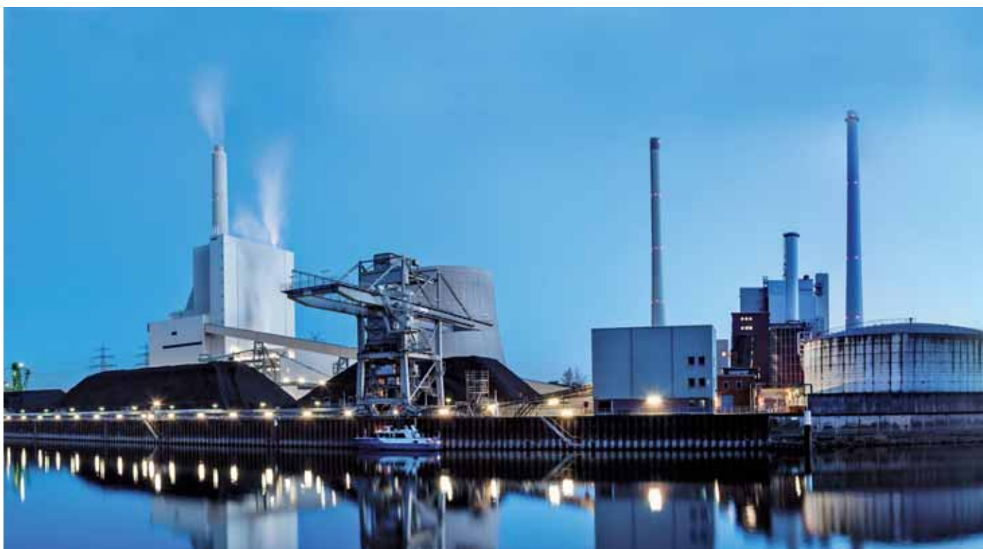
Neue Verordnung zu Meldepflichten im Rahmen der Energieerzeugung

» Hinweis: Zu beachten ist, dass für die EnSTransV nicht die Abgabenordnung, sondern das Verwaltungsverfahrensrecht maßgebend ist. Dadurch ist die Festsetzung von Zwangsgeldern und deren Vollstreckung nach dem Verwaltungsvollstreckungsgesetz möglich.