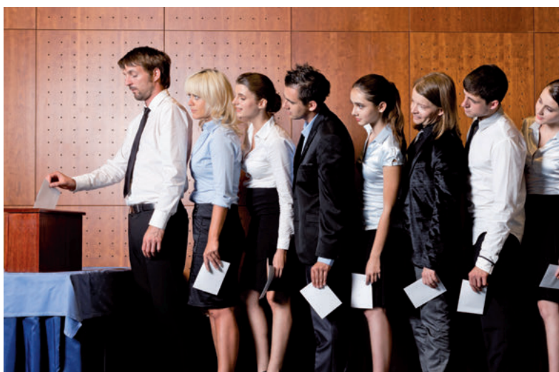
In 2018 steht in den Betrieben wieder der Gang zur Urne an.