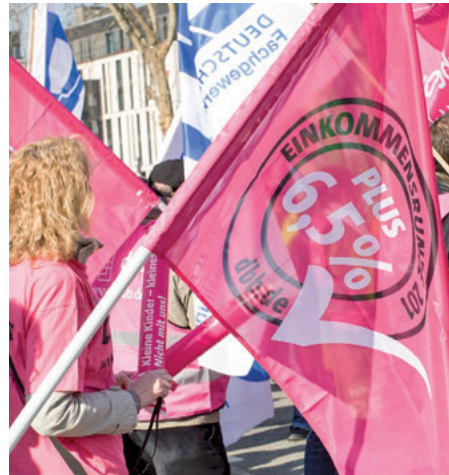
Anspruch auf Tariflohnerhöhungen auch nach Betriebsübergang

ist der neue Arbeitgeber zeitlich unbegrenzt verpflichtet, Tariflohnerhöhungen nachzuvollziehen, obwohl er selbst keine Möglichkeit hat, auf den Tarifvertrag Einfluss zu nehmen. Dies ist auch