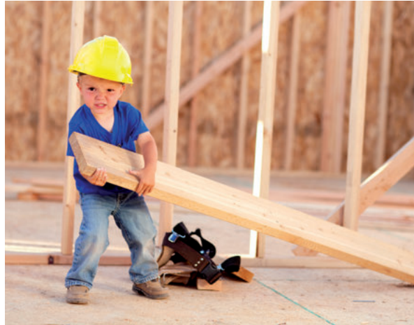
Wohnraumoffensive für Familien mit Kindern

(4) Kapitaleinkünfte: Die Abgeltungssteuer auf Zinserträge soll abgeschafft