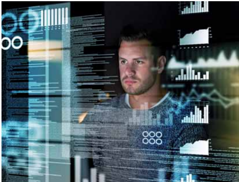
Neues Werkvertragsrecht vor allem im IT-Bereich von Bedeutung

ler sich binnen einer vom Unternehmer nach Fertigstellung gesetzten angemessenen Frist entweder überhaupt nicht zu dem Abnahmeverlangen äußert oder wenn er die Abnahme ohne Benennung von Mängeln verweigert (§ 640 Abs. 2 BGB n.F.). Bei