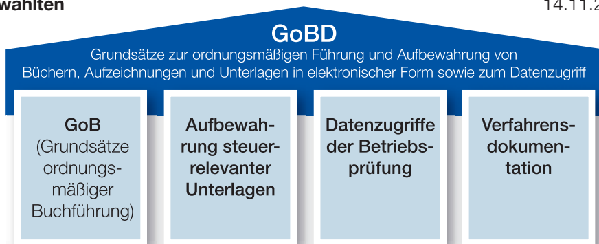
Abb. 1: Bereiche der GoBD

IV A 4 - S 0316/13/1003) einzuhalten. Nach den Grundsätzen zur ordnungsmäßigen Führung und Aufbewahrung von Büchern, Aufzeichnungen und Unterlagen in elektronischer Form sowie zum Datenzugriff (den GoBD) müssen alle elektronischen, aufbewahrungspflichtigen Geschäftsunterlagen – insbesondere steuerrelevante Daten – den Anforderungen hinsichtlich Datensicherheit, Unveränderbarkeit, Aufbewahrung und maschineller Auswertbarkeit genügen. Die GoBD lassen sich wie in Abb. 1 dargestellt strukturiert