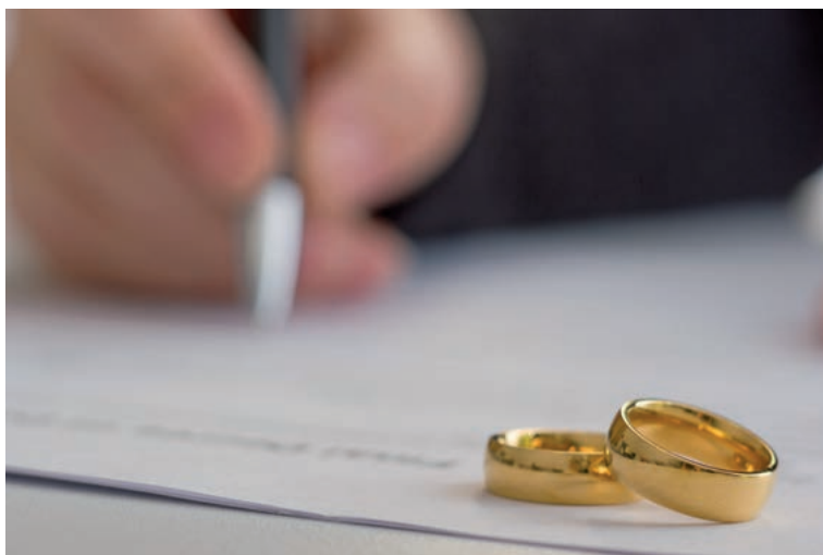
Wie weit reicht die richterliche Ausübungskontrolle bei Eheverträgen?

Auch soll er dadurch nicht besser gestellt werden, als hätte es die Ehe und die mit der ehelichen Rollenver-