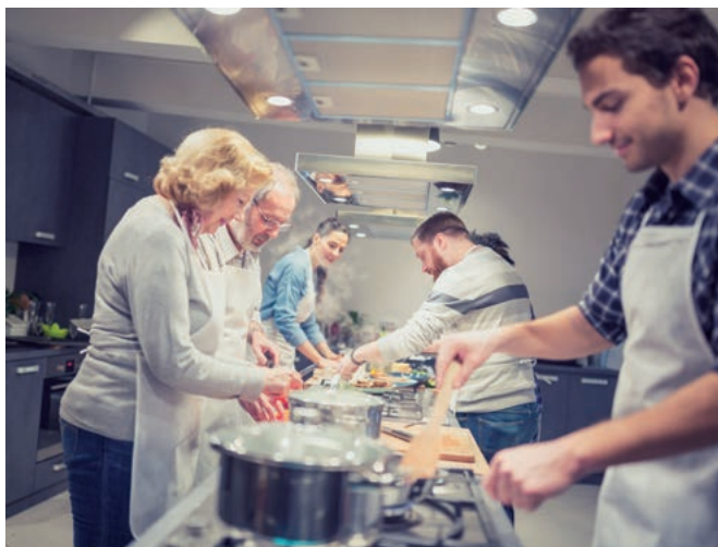
Kochkurs als Betriebsveranstaltung

Auslöser dieses Urteils war die Klage einer GmbH, welche einen Kochkurs für ihre Mitarbeiter als Betriebsveranstaltung durchgeführt hatte. Im Rahmen des Kochkurses durften die Teilnehmer unbegrenzt Getränke und Speisen verzehren. Es wurden 27 Teilnehmer angemeldet, von denen jedoch zwei kurzfristig absagten. Die Kosten der Veranstaltung blieben unverändert. Das Finanzamt verlangte, im Rahmen der Ermittlung der lohnsteuerpflichti-