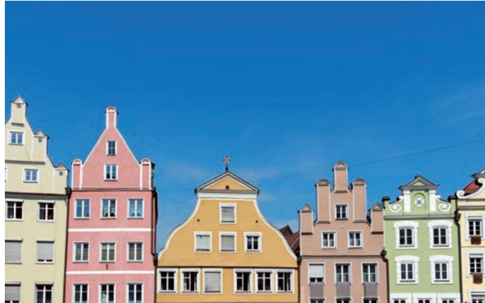
Grundsteuerliche Bewertung von Wohneigentum mit dem Stichtag 1.1.1964

Methode ist demnach nicht mit dem BewG vereinbar. Maßgeblich für die Höhe der Mieten bleiben auch bei Fortschreibungen und Nachfeststellungen immer die Wertverhältnisse im Hauptfeststellungszeitpunkt am 1.1.1964 . Die auf die Jahresrohmietae anzuwendenden Vervielfältiger sind den Anlagen des BewG zu entnehmen. Diese ergeben,