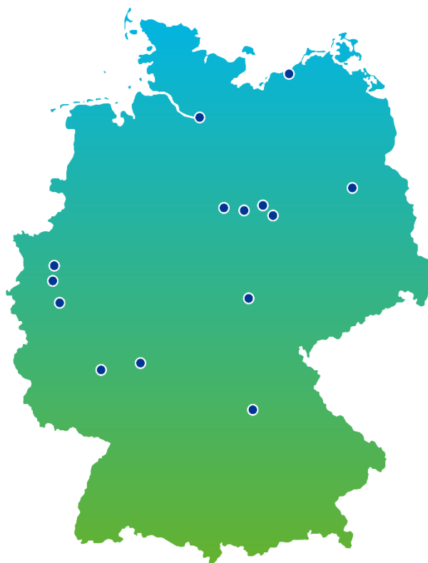
Представительства PKF Fasselt Schlage