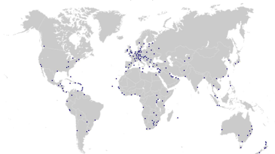
представительства PKF в мире